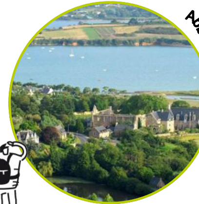
Abbaye de Beauport